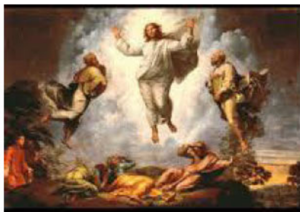
La Transfiguración cambia la vida

Pero, también tenemos la capacidad y las fuerzas para transfigurar, para cambiar más