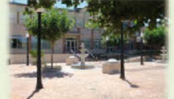
Espacios al aire libre en pleno Valle del Alberche