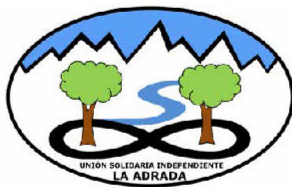
Unión Solidaria Independiente de La Adrada

Recibid un cordial saludo y ¡Felices Fiestas!