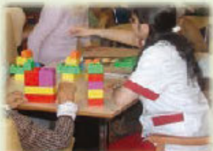
Atención especializada a Personas con demencia