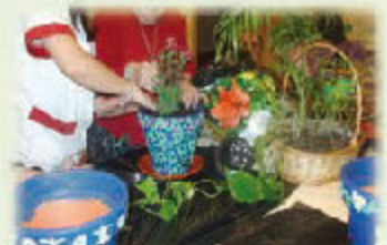
Talleres de Terapia y Estimulación

Un nuevo concepto de Residencia para nuestros mayores