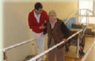
Fisioterapia y Rehabilitación Mañana y Tarde