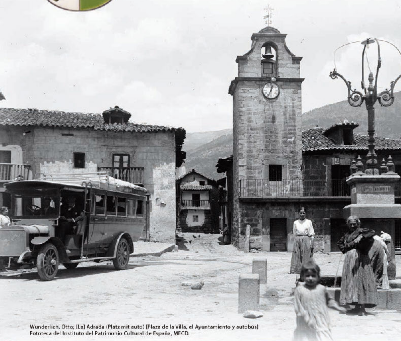
Wunderlich, Otto; [La] Adrada (Platz mit auto) [Plaza de la Villa, el Ayuntamiento y autobús] Fototeca del Instituto del Patrimonio Cultural de España, MECD.

Programa de fiestas del 1 al 9 de agosto Actividades culturales y de ocio verano 2015